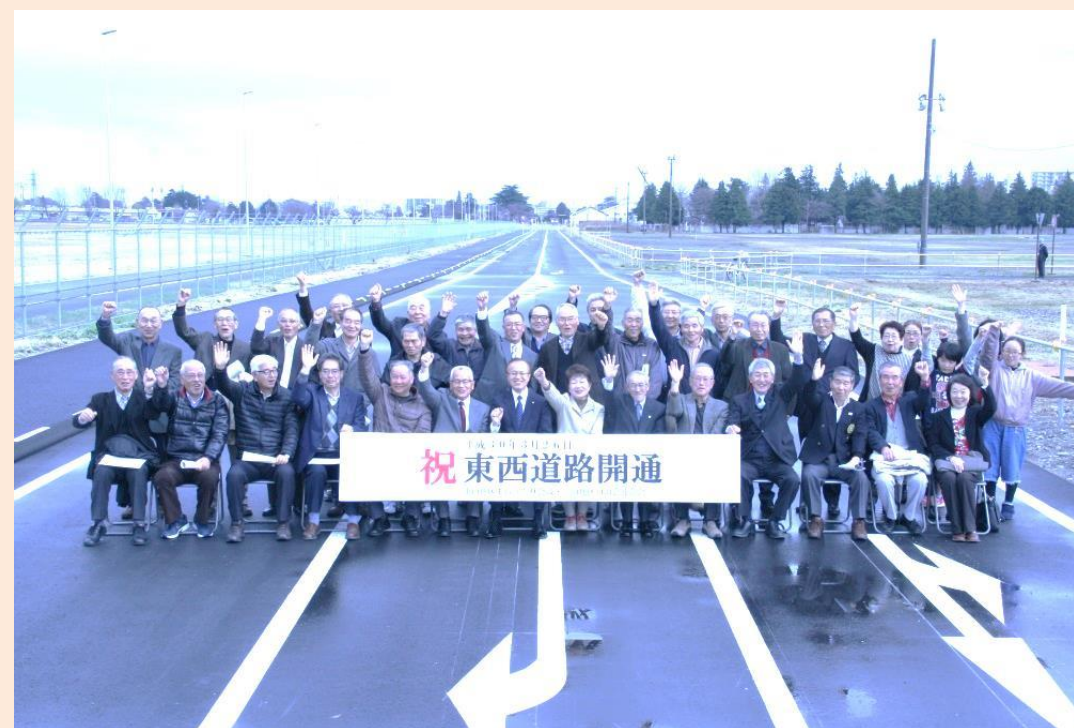
【 東西道路を背景に記念撮影 3月22日 】

撮影会に先立ち小山公民館にて開催された会議では、市から返還跡地の今後の計画も説明され、様々な施設建設が始まる度に地域の声を重視していく旨の説明がありました。