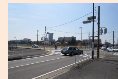
【開通後の 向陽小学校東交差点】